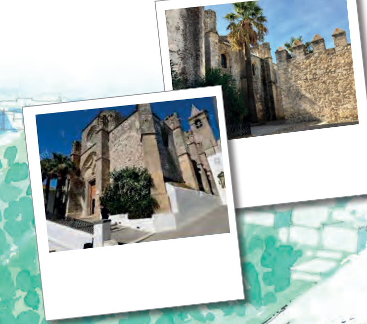
Calle de Juan Relinque

En 1538 tuvo lugar una escena dramática junto a esta iglesia y antiguo cementerio, en la que el vecino defensor de las hazas, Juan Relinque, se presenta a la salida de misa ante el alcalde y regidor de la villa, Tebedeo Velázquez y le muestra una Provisión firmada por el Rey que hacía referencia a una denuncia contra los abusos de poder de éste. Tebedeo Velázquez, con vara de justicia en mano, se vuelve, lo mira y le increpa que quien le quiera destruir, también él lo destruirá. Juan Relinque responde a dichas palabras manifestando que él solo pide justicia. Esta escena pudo terminar en tragedia si no es por los vecinos presentes.