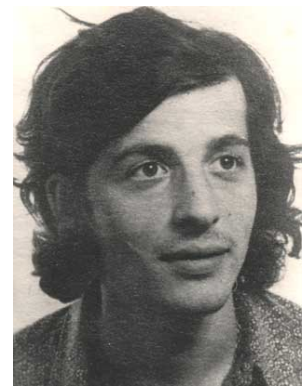
Salvador Puig Antich

La primera militancia de Salvador fue en las plataformas de Comisiones Obreras, en la Comisión de estudiantes, pronto evolucionó hacia posiciones anarquistas, que rechazan las jerarquías o el dirigismo en las organizaciones políticas y sindicales. Tras finalizar la mili se incorpora al Movimiento Ibérico de Liberación (MIL), integrándose en su rama armada en lucha contra el capitalismo. Los MIL no se consideran un grupo como el FRAP o ETA, ya que nunca atentaron contra fuerzas de seguridad ni pusieron bombas. Las acciones principales eran robos a bancos, y con esos botines financiaban las publicaciones clandestinas del grupo, como la revista CIA (Conspiración Internacional Anarquista) y el editorial "mayo 37". La policía creó un grupo especial para desarticularlo, y que acabó con la detención de Antich, juzgado en consejo de guerra, y su posteriormente su ejecución mediante garrote vil el 2 de marzo de 1974, en la cárcel Modelo de Barcelona.